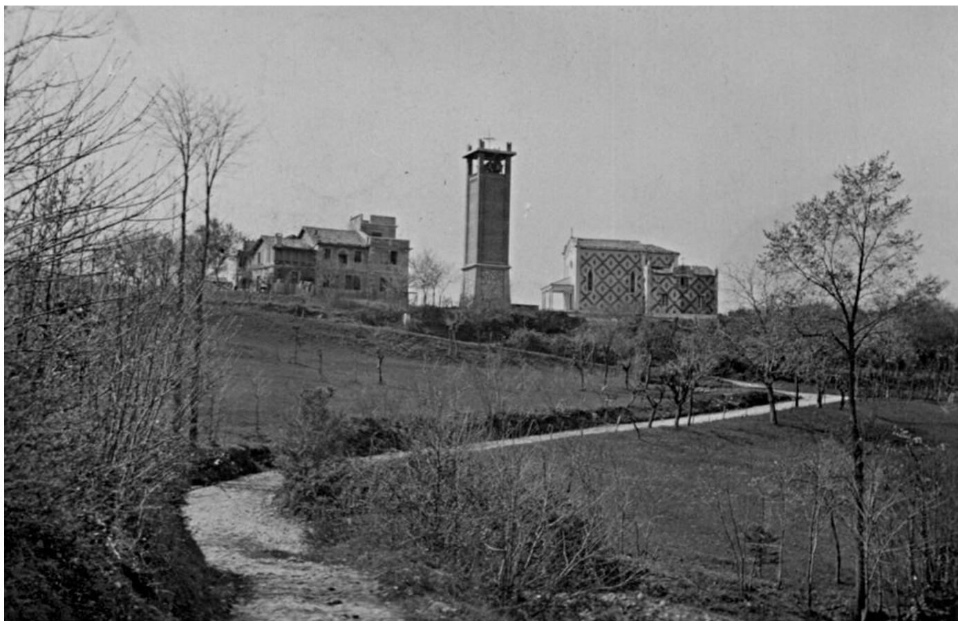
Madonna delle Grazie nel 1943 il Santuario e la Casa del Pellegrino ripresi dalla strada che sale da Costabissara

Pia Società San Gaetano - Vicenza - ad uso interno